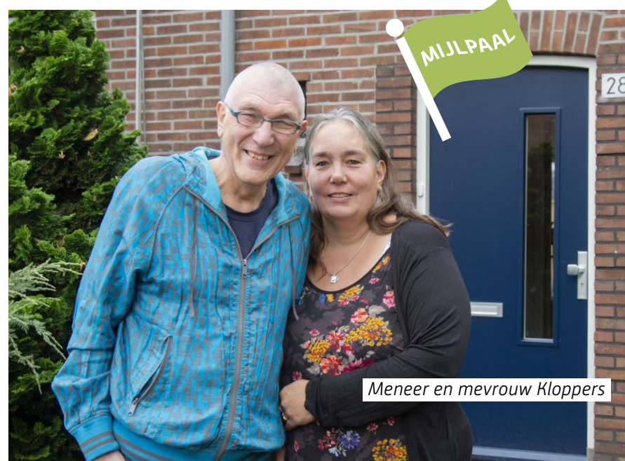
Meneer en mevrouw Kloppers