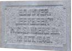
De eerste steen Ruim zeventig jaar geleden, op 12 oktober 1946, werd de eerste steen gelegd.